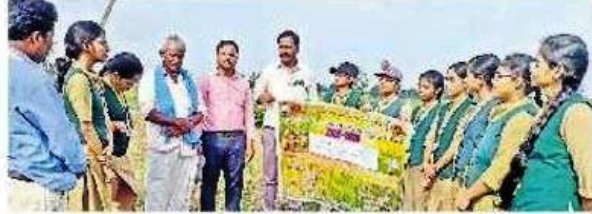
రైతులకు అవగాహన కల్పిస్తున్న కేఎల్ వ్యవసాయ కళాశాల విద్యార్థులు