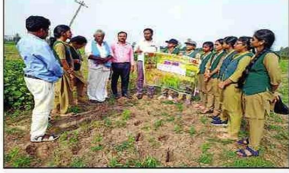
అవగాహన కల్పిస్తున్న విద్యార్థినులు

నైరుతీరుతు పవనాల కారణంగా బలమైన ఈదురు గాలులు, ఉరుములు, మెరుపులతో పిడుగులు పడే ప్రమాదం ఉన్నందున వ్యవసాయ భూముల్లో ఉన్న రైతులు అప్రమత్తంగా ఉండాలి