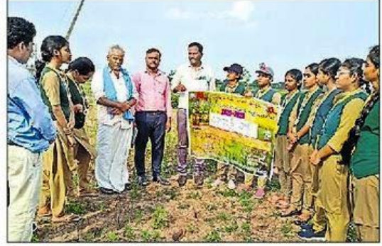
రైతులకు అవగాహన కల్పిస్తున్న కేఎల్ఎస్ విద్యార్థులు